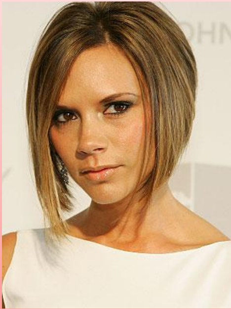
Victoria Beckham (Ex-Spice Girl)

“Nasci em Hertfordshire, Inglaterra. Os meus pais eram muito ricos e cheguei a pedir-lhes que não me deixassem em frente da escola, para que os meus amigos não vissem o nosso Rolls-Royce. Muitos tinham inveja e também gozavam comigo devido ao meu acne.”