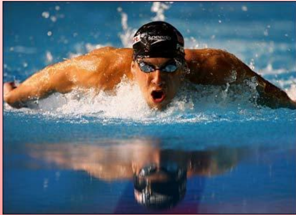
Michael Phelps (Nadador olímpico)

“Fui vítima de bullying devido ao meu andar desajeitado e às minhas grandes orelhas. Depois dos meus triunfos, alguns daqueles rapazes que me trataram mal, tentaram aproximar-se de mim, mas eu disse-lhes que não me lembrava deles. Acho que se sentiram como eu há muitos anos atrás!”