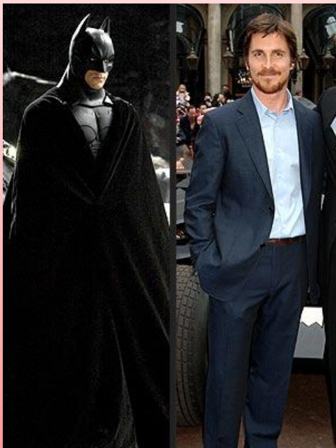
Christian Bale (Actor)

“Quando era miúdo levei sovas de outros rapazes sem perceber o motivo... As agressões duraram muito tempo e eu apenas desejava que parassem! Hoje percebo que tudo o que passei na infância deu-me força para seguir o meu sonho e ser o homem que sou hoje.”