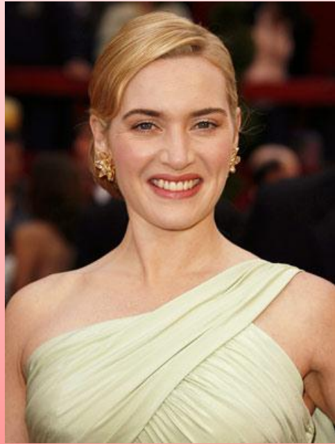
Kate Winslet (Actriz)

“Em miúda tornei-me muito tímida por causa do meu excesso de peso. Quando tinha 16 anos chamavam-me “Bolha”, era patético e infantil. Isto durou dois anos, até que contei à minha mãe e ela falou com o presidente da escola que resolveu a situação sem expor a minha identidade. Acho que o anonimato é muito importante nestas situações.”