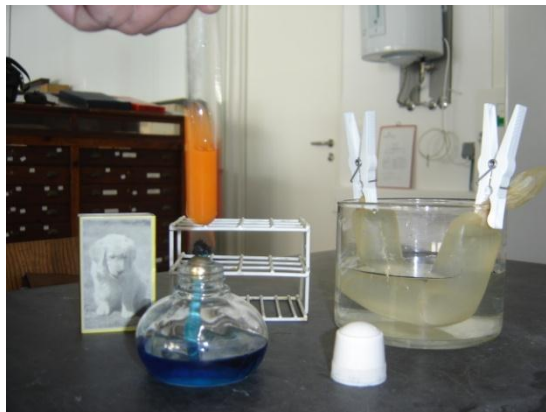
Formação de um precipitado cor de tijolo quando aquecido

9.2 Realizar um quadro onde se indiquem os resultados obtidos no final da experiência e as respectivas conclusões.