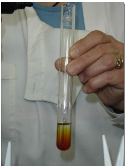
Manutenção da cor castanha do Soluto de Lugol