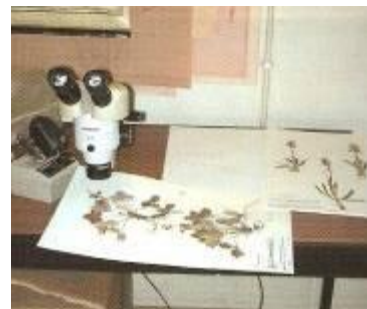
Figura 10-Lupa binocular

- Indicar, junto de cada exemplar o nome da espécie, o género ao qual pertence, o nome vulgar, o local e dia da colheita, assim como o colector;