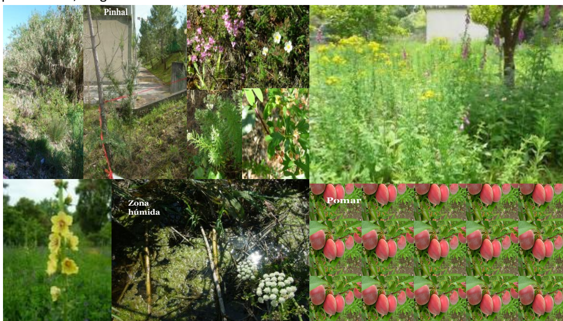
Figura 1 – Diferentes aspectos da zona envolvente à escola

Para além das respostas que a biotecnologia pode oferecer, é necessário mudar de atitudes. Essa mudança implica, literacia científica que nos auxilie a compreender e a respeitar o mundo em que vivemos. Cabe-nos, também a nós, professores, ajudar os jovens nessa caminhada, ajudando a conhecer melhor o que está à nossa volta. A utilização de actividades práticas no ensino das ciências é essencial para a formação dos alunos. As actividades práticas de campo, ou de laboratório, em particular as experimentais, são importantes por desenvolverem nos discentes conhecimentos conceptuais, procedimentais e atitudinais, e por serem geralmente vivências motivadoras e estimulantes face à aprendizagem. Permitem o desenvolvimento de capacidades de comunicação, estimulam a cooperação, o espírito crítico, o raciocínio lógico, a persistência, o rigor e a criatividade.