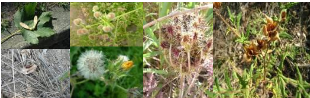
Figura 14 - Diferentes tipos de sementes