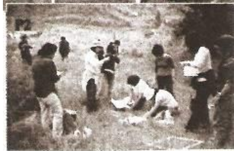
Figura 3- Marcação da unidade de amostragem