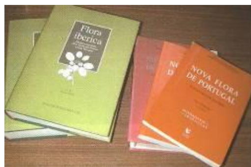
Figura 5 – Floras