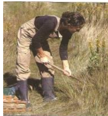
Figura 4 – Colheita de material

Para isso as plantas têm que ser arrancadas da terra com o auxílio da pá de jardineiro, ou enxada, para que raiz não seja deteriorada;