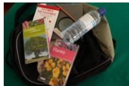
Fig. 2 – Material a utilizar