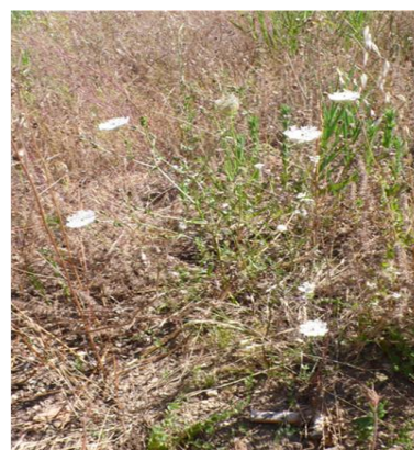
Figura 13- Exemplo de apresentação

Encontrada nos campos e terrenos arborizados em toda a Europa com excepção do extremo norte. Vegeta em solos alcalinos, rochas costeiras e dunas fósseis.