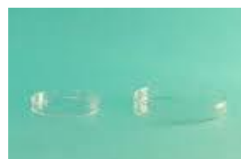
Figura 2 – Caixa de Petri