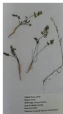
Figura 11-Folha de herbário