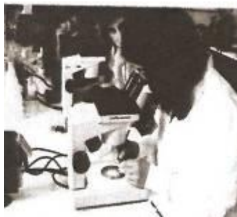
Figura 9- Observação ao M.O.C.