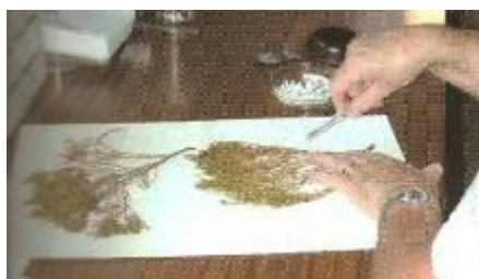
Figura 12 – Montagem do material na folha do herbário

- Fazer uma ligeira descrição de cada um dos exemplares colhidos;