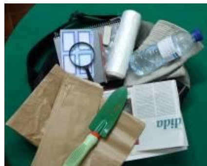
Figura 1 - Material a utilizar